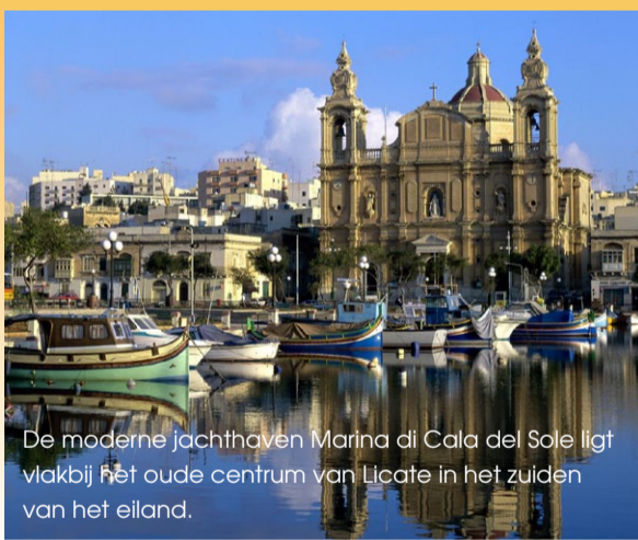
De moderne jachthaven Marina di Cala del Sole ligt vlakbij het oude centrum van Licata in het zuiden van het eiland.

Heeft u zin gekregen in een vakantie op (of rond) Sicilië, kom dan in januari naar de Vakantiebeurs 2014 in Utrecht. Daar laat de grootste regio van Italië zich van zijn beste kant zien. Voor twee bijzondere botenbeurzen kunt u terecht in Gorinchem (27 en 28 september) en Genua (5 - 13 oktober). Zie hiervoor ook: www.salonedigenova.com